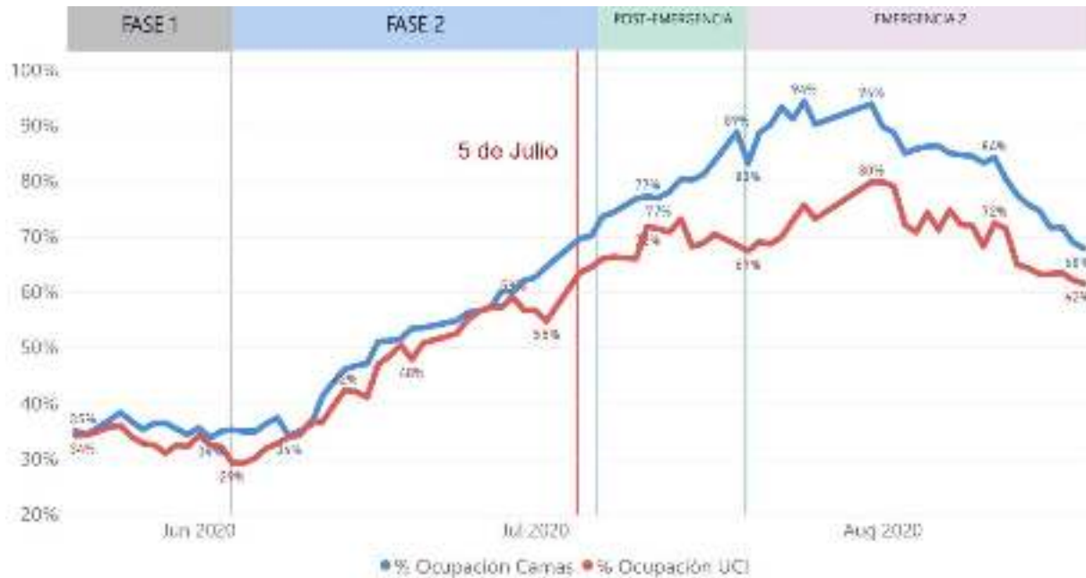
Figura 3. Comportamiento de las hospitalizaciones, ocupación UCI y Ventiladores para COVID 19. República Dominicana, al 20/8/2020