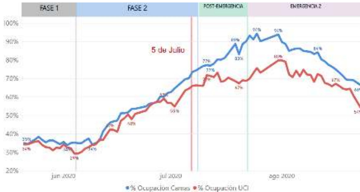
Figura 3. Comportamiento de las hospitalizaciones, ocupación UCI y Ventiladores para COVID 19. República Dominicana, al 28/8/2020