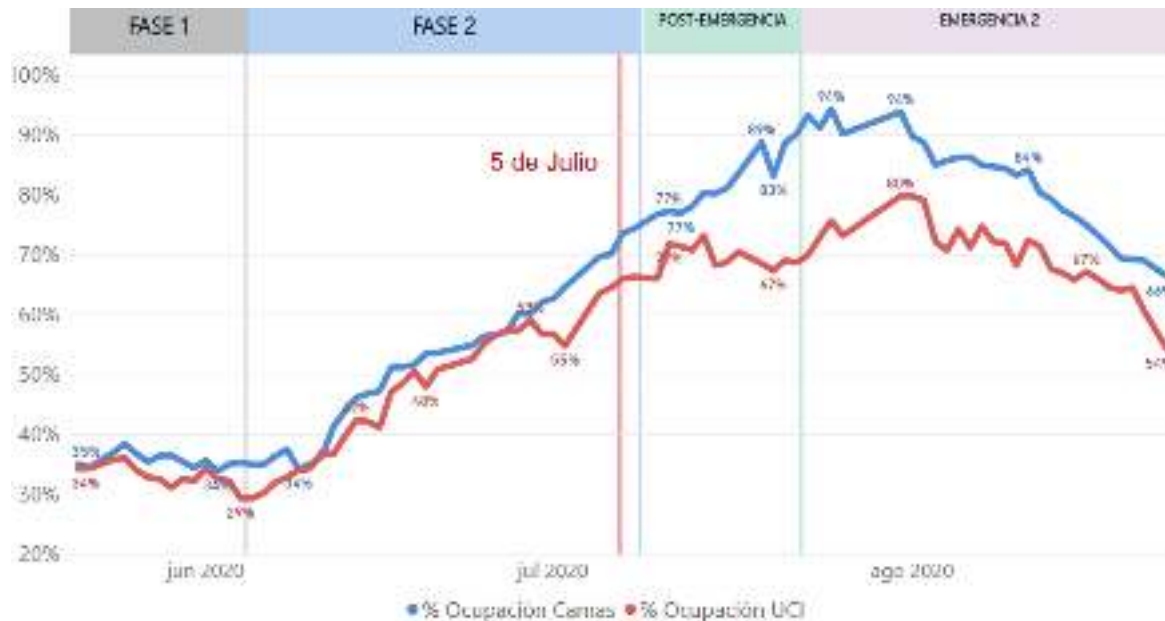
Figura 3. Comportamiento de las hospitalizaciones, ocupación UCI y Ventiladores para COVID 19. República Dominicana, al 29/8/2020