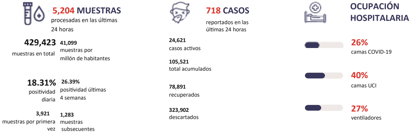
Figura 1. Tendencia de los casos y positividad de COVID-19 en República Dominicana al 15/09/2020