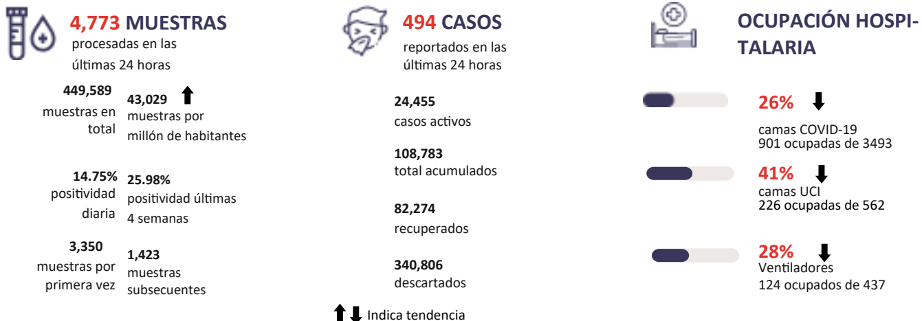
Figura 1. Tendencia de los casos y positividad de COVID-19 en República Dominicana al 20/09/2020