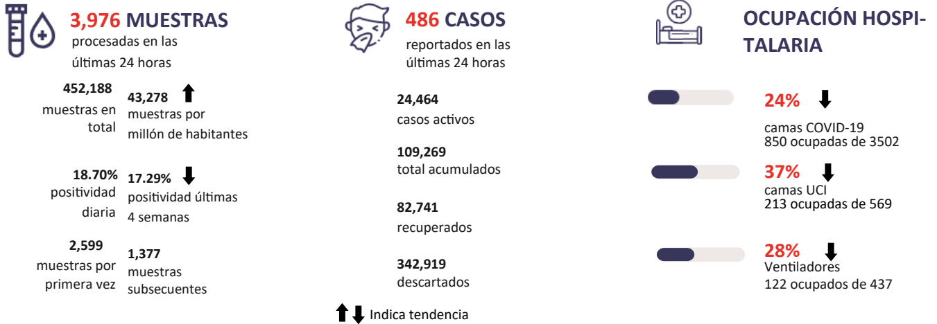
Figura 1. Tendencia de los casos y positividad de COVID-19 en República Dominicana al 21/09/2020