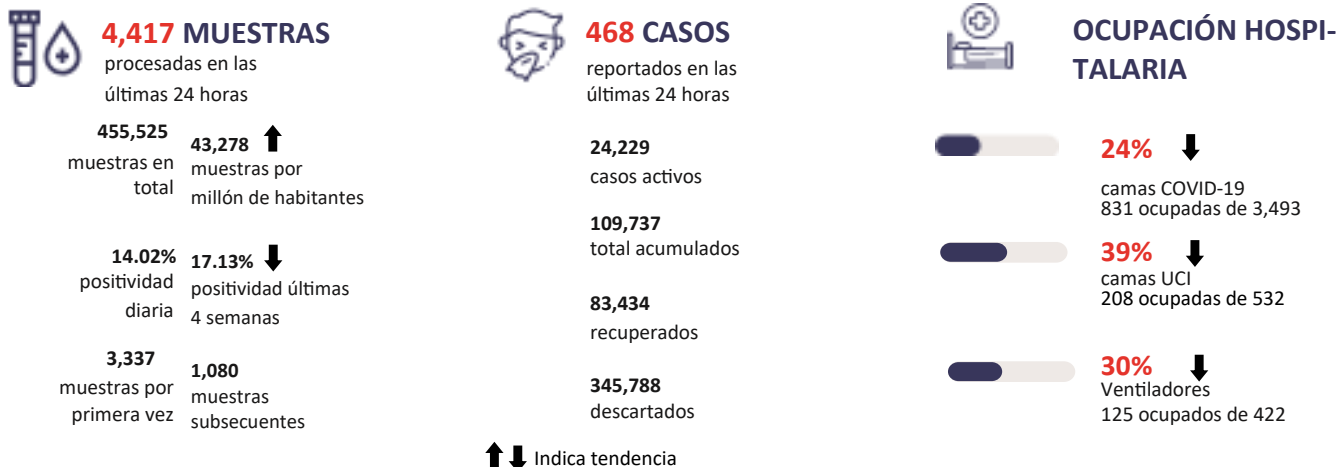
Figura 1. Tendencia de los casos y positividad de COVID-19 en República Dominicana al 22/09/2020