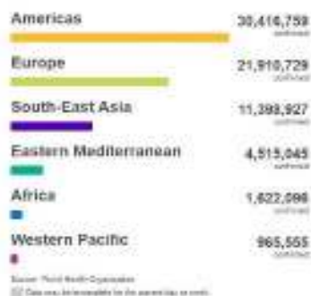
Casos a nivel mundial, por región

752.52 Mortalidad por millón de habitantes