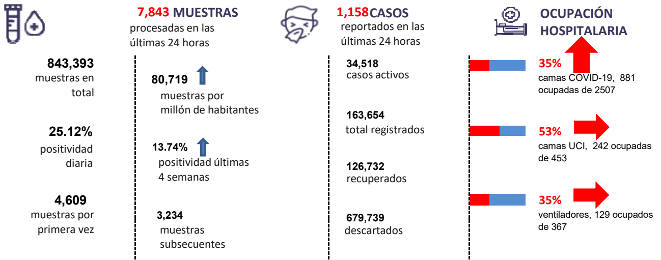
Figura 1. Tendencia de los casos y positividad de COVID-19 en República Dominicana