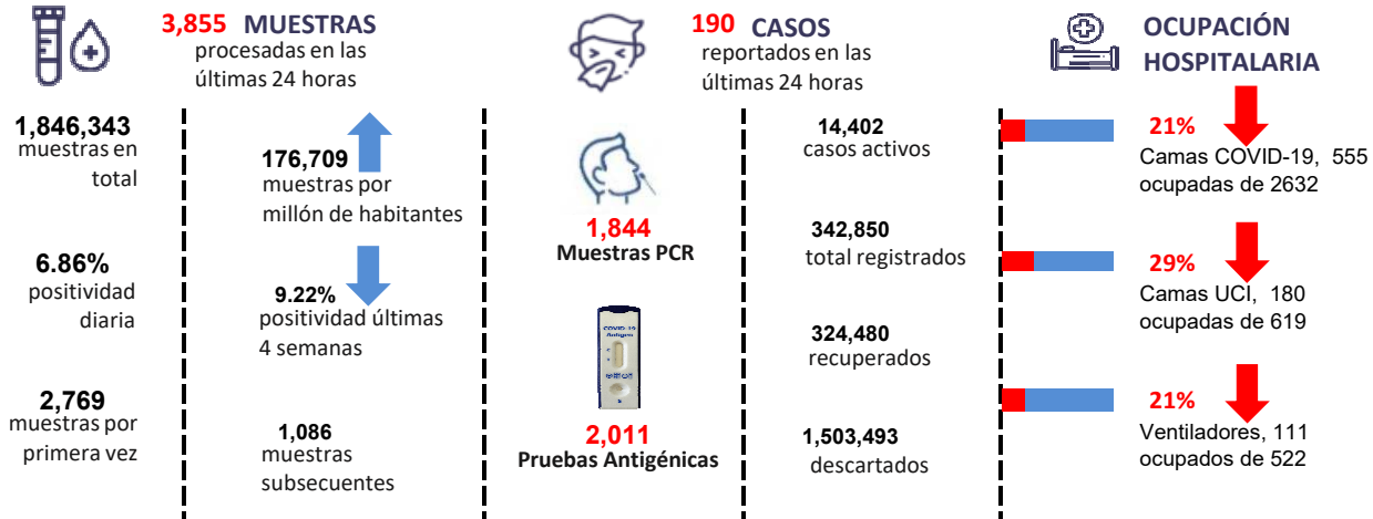
Figura 1. Tendencia de los casos v positividad de COVID-19 en República Dominicana