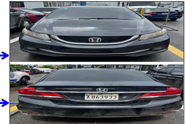
CARRO HONDA CIVIC NEGRO