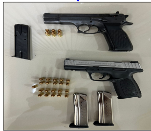
ARMAS DE FUEGO UTILIZADAS PARA COMETER LOS HECHOS