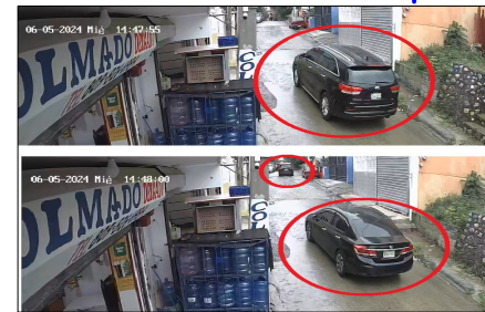
05/06/2024 DIA QUE ENTREGARON EL VEHICULO

CELULAR IDENTIFICADO EN EL PROCESO DE INESTIGACION